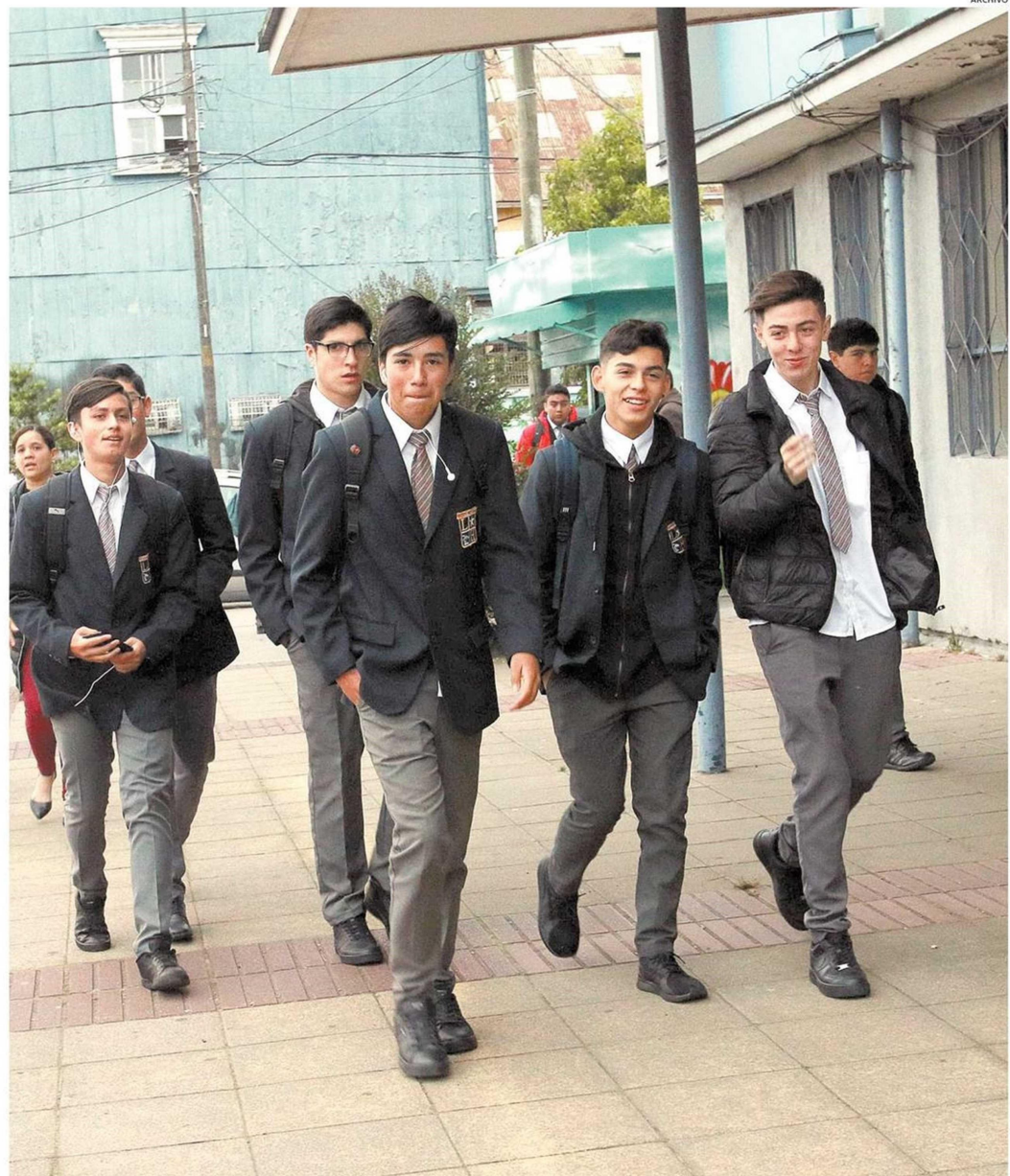
UN PANORAMA QUE SÓLO DURÓ DOS SEMANAS ESTE AÑO ESTE AÑO, YA QUE LA PANDEMIA TRASTOCÓ COMPLETAMENTE LAS CLASES PRESENCIALES EN LOS COLEGIOS.