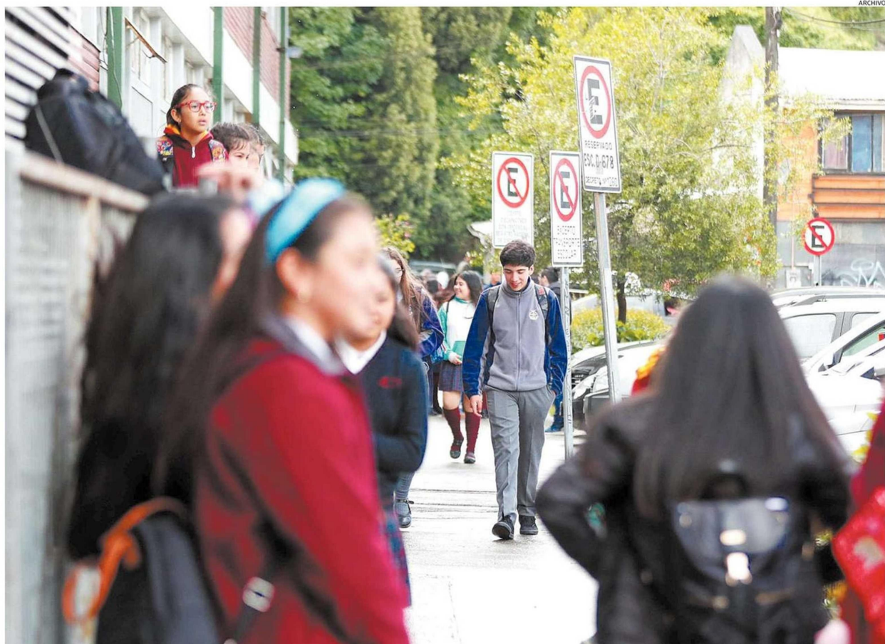
MÁS ALLÁ DE CUÁNDO SE PRODUZCA EL RETORNO A CLASES, LOS ENTENDIDOS EN EDUCACIÓN PLANTEAN QUE LA MODALIDAD NO PRESENCIAL LLEGÓ PARA QUEDARSE.

-Será complejo porque se tienen que reacomodar muchas realidades que no estaban atendidas. Por ejemplo, estas oportunidades responden a cosas que no hacíamos y que deberíamos haber realizado, como preocuparnos del estudiante en su calidad de persona, de las familias; del entorno, de la realidad, y no sólo cuando el estudiante llega al colegio, a la universidad. Entonces, tenemos que realizar una mirada autocrítica y ese es el futuro que tenemos que implementar de ahora y en adelante. Hay que entender al estudiante en su calidad de persona, junto a su familia y su entorno. Si nos quedamos con el concepto de oportunidad estamos evidenciando lo que no lo hicimos antes o que lo hicimos de forma errada.